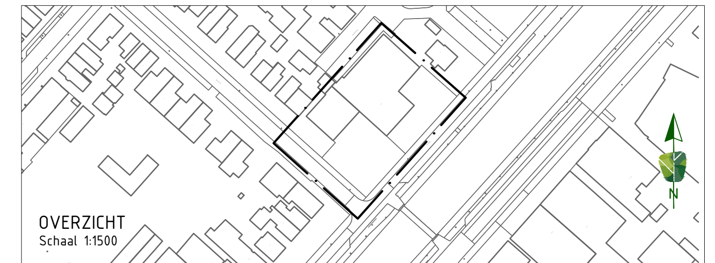
OVERZICHT Schaal 1:1500